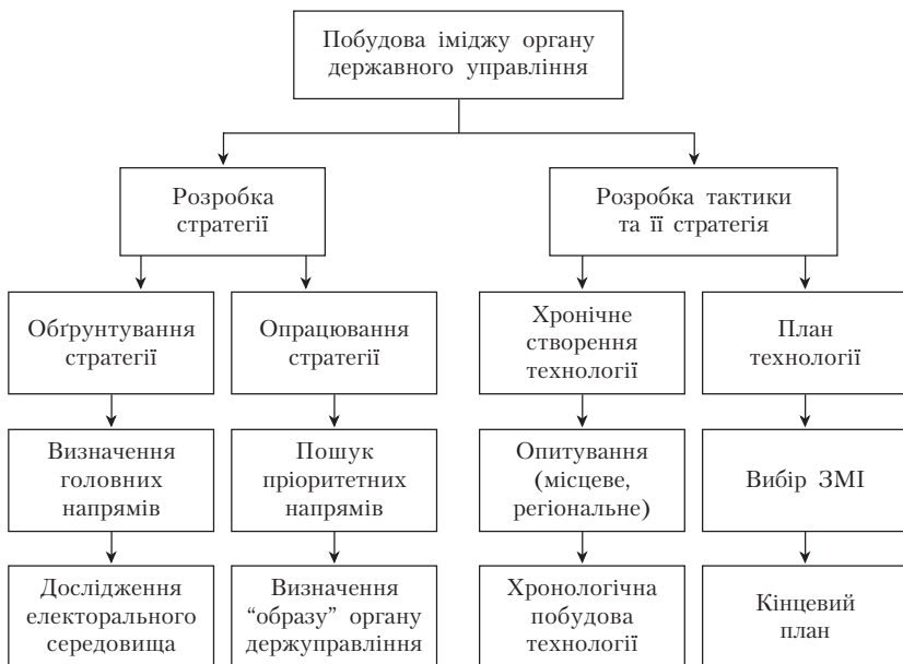
Рис. 3. Побудова іміджу органу державного управління

більш ефективних засобів політичної комунікації; б) кінцевий план (необхідні й додаткові корисні засоби та методи інформації).