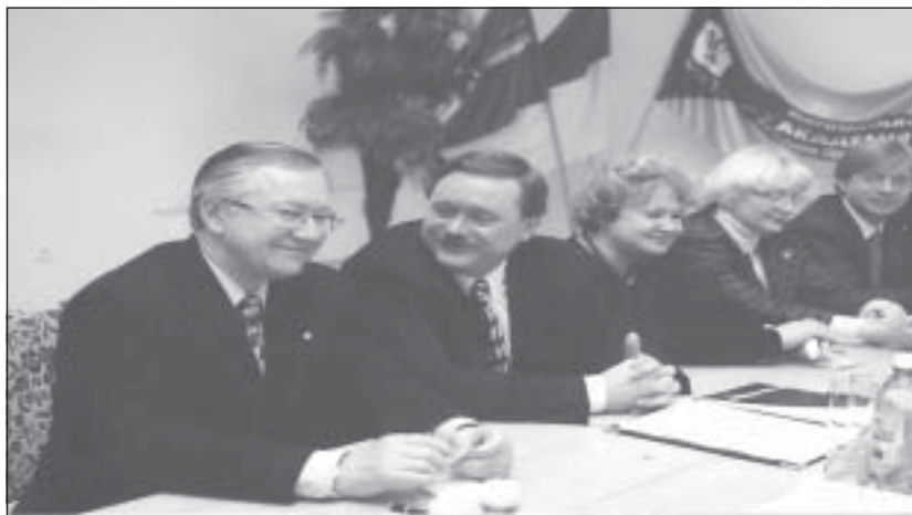
Під час відкриття міжнародної науково-практичної конференції: ректор МАУП В. Бебик і Голова РМ АРК С. Куніцин