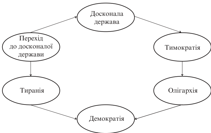
Мал. 1. Платонівський кругобіг державного устрою

аристократія, трудящі), поділ яких історично зумовлений виконанням різних соціальних функцій, що потребують різних здібностей і відповідають певним базовим цінностям.